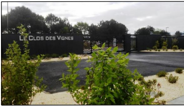
Accès Rue Léon Nicolle